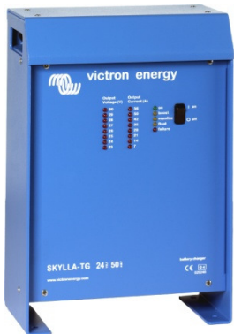
Skylla Charger 24V 50A